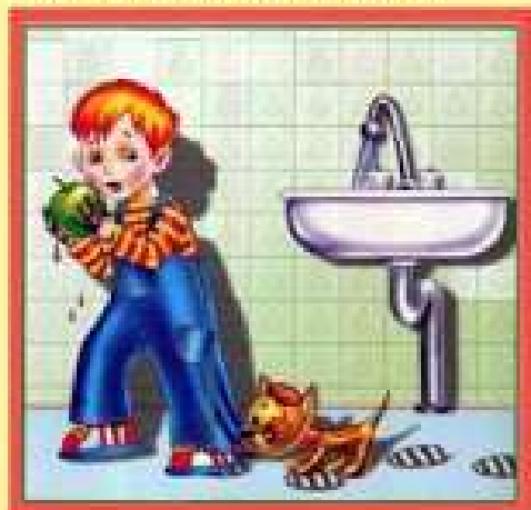
Мойте руки перед едой