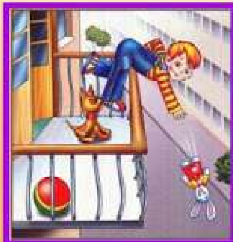
Не играй на балконе, упадешь