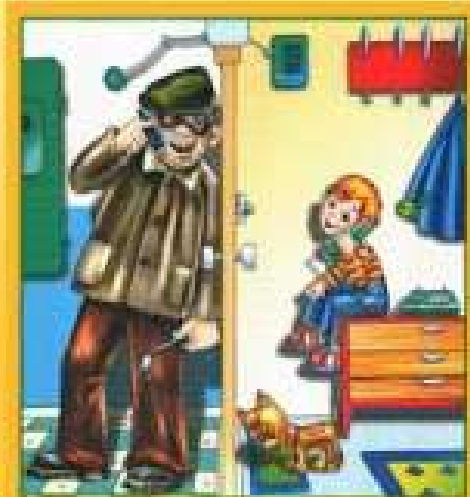
Не разговаривай и не открывай дверь незнакомым людям